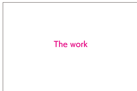
The Work Caption