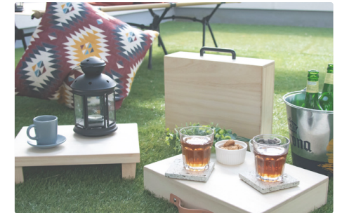
KIRI BOX (2023)

モリクラフトは「幸せをデザインしよう」を合言葉に活動しているフリーランスのデザイナーです。ブランディング、Web サイト、パンフレット、ロゴマーク、DMなどのデザインをしています。